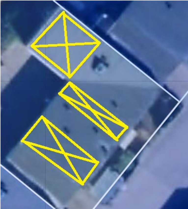
Skitse 4 Placering på 1 plan 119 kvm a (Hvid: matrikel grænse, gul: solceller)