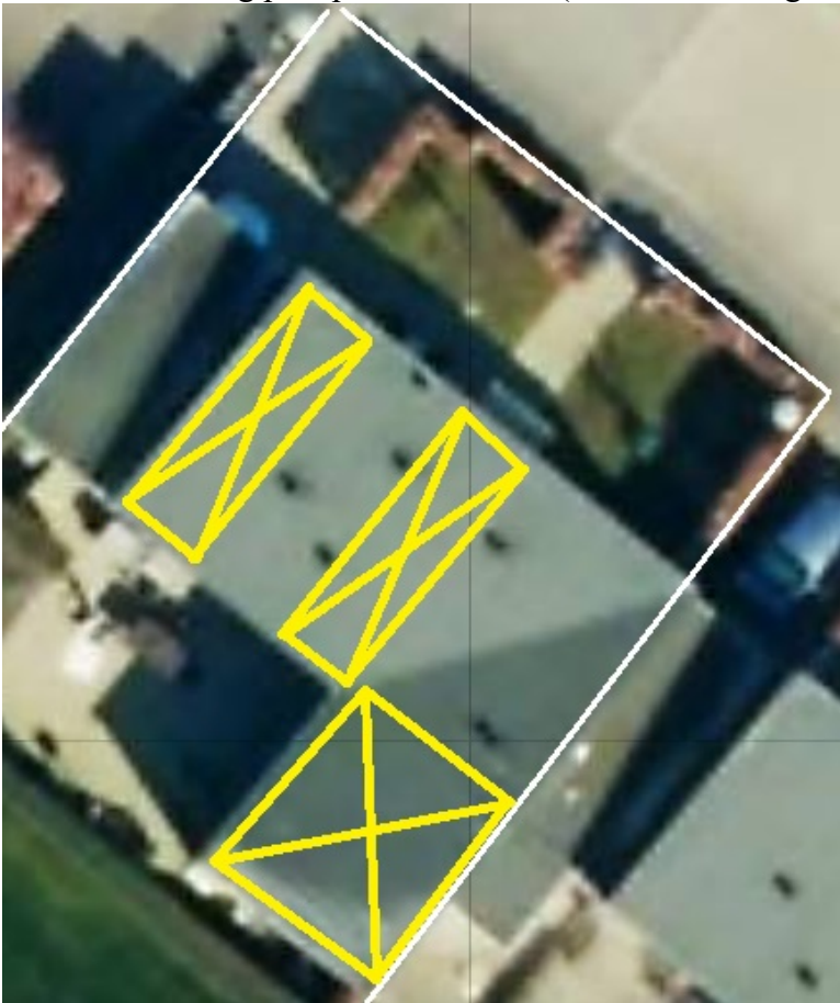
Skitse 5 Placering på 1 plan 119 kvm b (Hvid: matrikel grænse, gul: solceller)