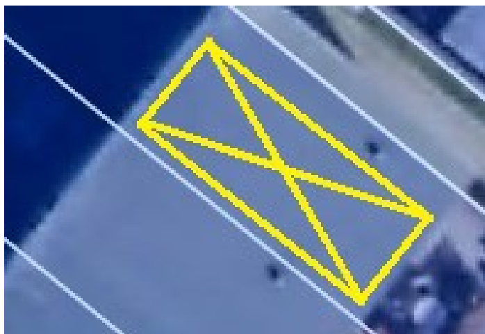
Skitse 2 Placering på 2 etages huse (Hvid: matrikel grænse, gul: solceller)