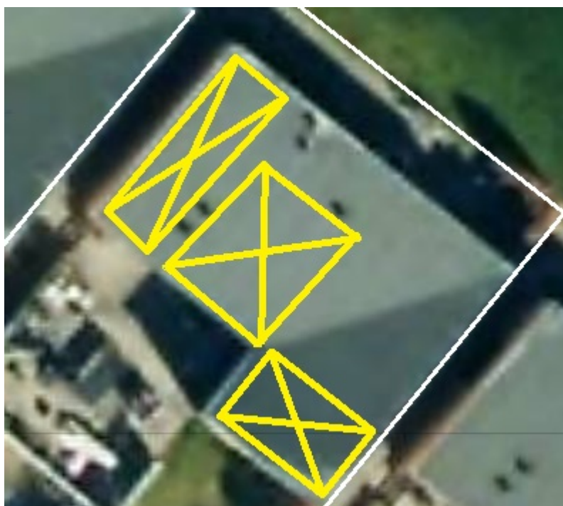
Skitse 3 Placering på 1 plan 109 kvm (Hvid: matrikel grænse, gul: solceller)